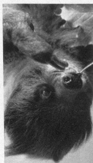
HENRI D'ORLÉANS