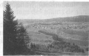
Vue de L'Auberson, une région jadis riche en fer.

Depuis longtemps, les ducs de Savoie tentaient par la ruse et par la force de s'emparer de Genève et d'en faire l'une de leurs villes sujettes. Pour les aider à réaliser cette ambition, des nobles savoyards mais aussi vaudois auxquels, d'ailleurs, s'était joint le comte de Gruyères formèrent une ligue dite des «Chevaliers de la cuillère».