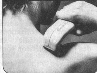
Douleurs musculaires ou articulaires

Nul ne doute plus aujourd'hui de l'action anti-douleurs de l'énergie statique, utilisée dans ce but depuis plus de 50 ans. Cette énergie est maintenant domestiquée dans le STATIQUICK!