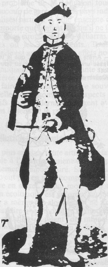
Sergent des fusiliers royaux de Naples

«Nous étions jeunes alors... vingt, vingt-cinq ans au plus. Le travail manquait en Gruyère, comme partout dans le pays. Beaucoup étaient déjà partis pour les Amériques. On disait que là-bas on vous donnait de la terre à culti-