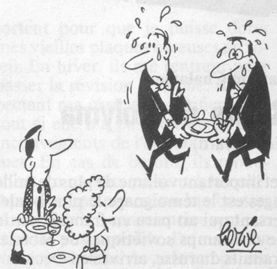
— Aïe! Aïe! Voilà l'addition!... (Dessin de Hervé-Cosmopress)