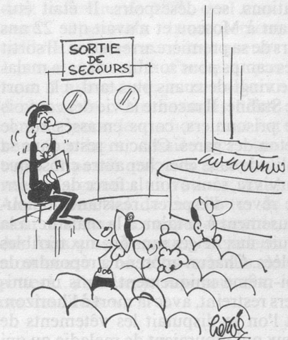
— C'est la place préférée de l'auteur!... (Dessin de Hervé-Cosmopress)