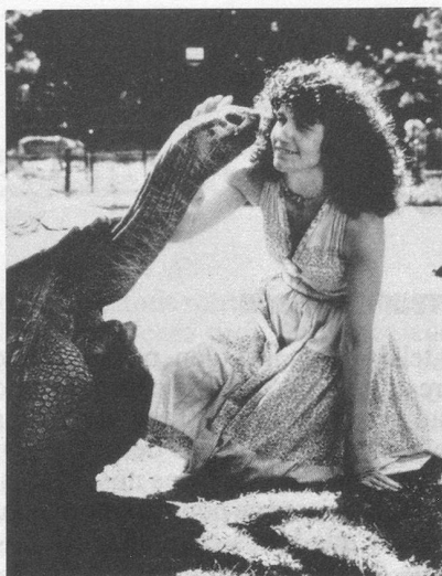
Photo: Kiki la tortue et l'auteur du livre

«Cent ans déjà. Vous m'appellez la plus vieille dame de France. Vous devriez consulter la notice devant mon enclos... je ne suis pas une dame, mais un monsieur, un très vieux monsieur. A quoi le reconnaît-on? Simple: ma plaque ventrale légèrement concave s'imbrique sur le dos de ma femelle. N'essayez pas de vérifier: pour cela il faudrait me retourner, ce qui, vu mon poids, ne serait pas une mince