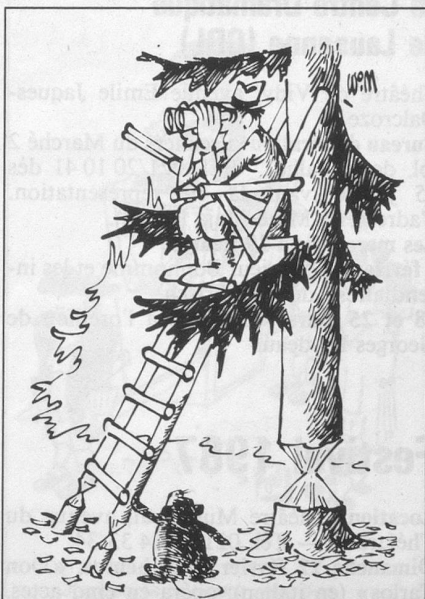
Sans paroles (Dessin de Moese-Cosmopress)

Tous nos voyages sont accompagnés du départ au retour en Suisse.