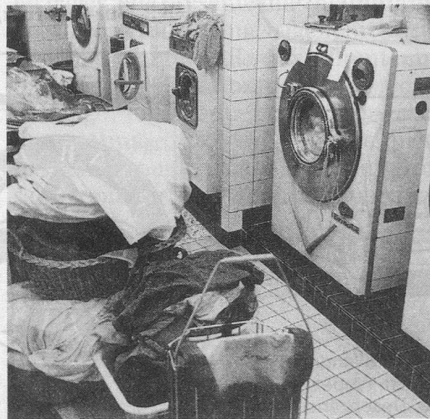
On ne chôme pas au salon-lavoir.