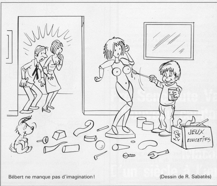
Bébert ne manque pas d'imagination!

Préfacé par le conseiller fédéral Léon Schlumpf, ce livret fort utile des CFF a bénéficié de la collaboration de l'Association suisse du sport (ASS) et de l'Office national suisse du tourisme (ONST). On peut l'obtenir au prix de 6 francs, jusqu'à épuisement du stock, au «CFF-Shop», Case postale 29, 3000 Berne 26, ainsi que dans les gares.