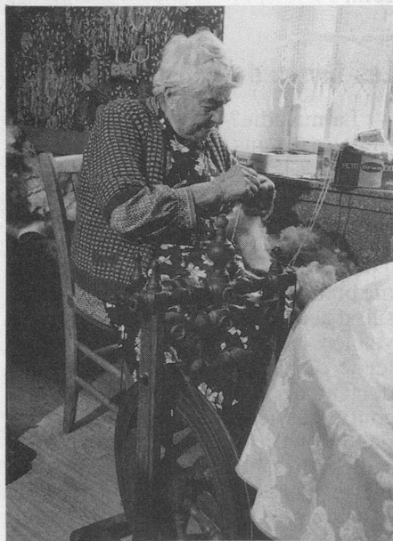
Depuis quatre-vingts ans le même rouet dé-gourdi, dans la même chambre du petit bistrot de Quincy.