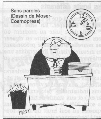
Sans paroles (Dessin de Moser-Cosmopress)

Je passerais bien les trois jours de mon escapade à flâner tout simplement dans les ruelles pavées (d'où sont exclues les automobiles), à faire du lèche-vitrines. Les boutiques luxueuses aux noms prestigieux voisinent avec de modestes échoppes: merceries vieille mode où l'on peut acheter un seul bouton, papeteries où je choisirai les cartes postales à envoyer aux amis avec l'invariable formule: «Je suis enthousiasmé d'Aix!» MC