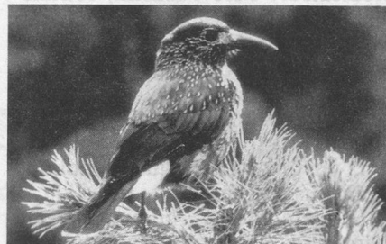
Le Cassenoix, l'aide forestier parmi les oiseaux, transporte et cache les graines d'aroles dans la terre. Il contribue ainsi au rajeunissement des forêts d'aroles.

Pour répondre aux nombreuses questions que se pose tout un chacun au sujet du dépérissement des forêts, la Station ornithologique suisse a lancé un programme de recherche sur l'écologie des oiseaux forestiers. Pour informer le public, une brochure attrayante et illustrée de photos en couleur a été éditée.