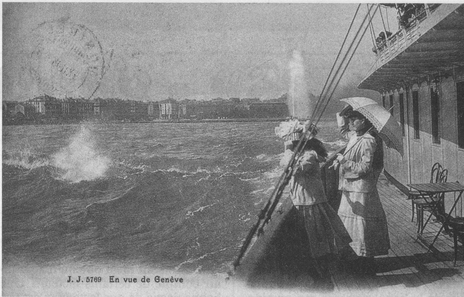
J. J. 5769 En vue de Genève