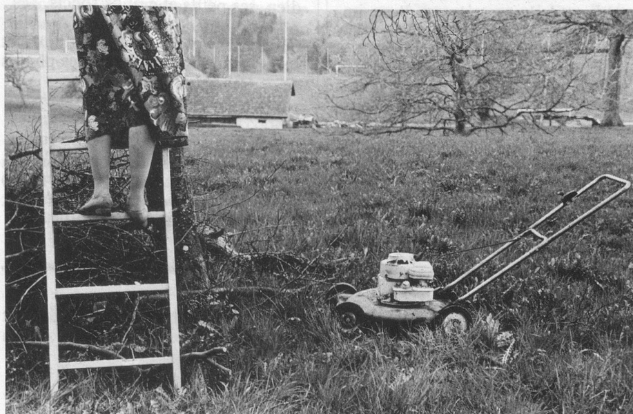
«Ebranchage, échelles, tondeuze à gazon, principales sources d'accidents».

...ou comment ne pas faire partie des 20 000 accidentés du petit jardin recensés chaque année en Suisse.