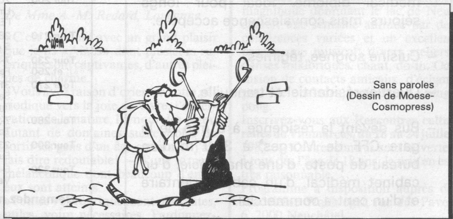
Sans paroles (Dessin de Moese-Cosmopress)

naissent l'envie, les querelles, les calomnies, les mauvais soupçons». Une chose reste sûre: l'amour bannit le soupçon. Pasteur J.-R. L.