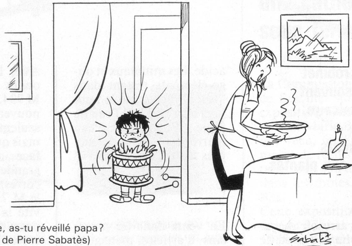
– Pierre, as-tu réveillé papa? (Dessin de Pierre Sabatès)

Ne pas utiliser ce coupon pour le renouvellement de l'abonnement svp.