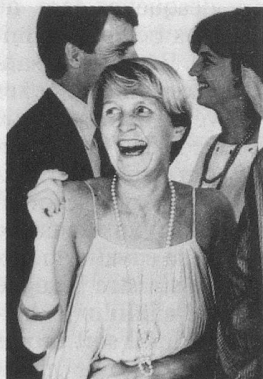
En Suisse, plus de 200 000 femmes et hommes souffrent, à des degrés divers, d'incontinence d'urine.

Beaucoup de personnes voudraient mais n'arrivent pas à maîtriser les problèmes d'hygiène que leur pose l'incontinence d'urine.