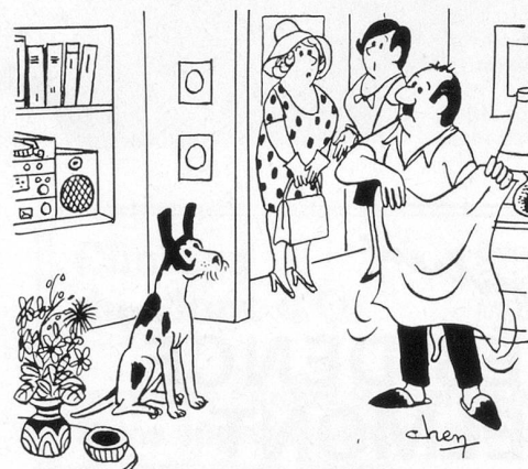
...Nous avons passé nos vacances en Espagne!... Dessin de Chen (Cosmopress Genève)