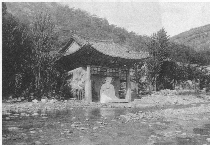
Le temple du Bouddha Blanc

tes dans le fleuve qui coule au bas du précipice, comme une pluie de fleurs humaines explorées par le sort malheureux de leur seigneur et maître. Ainsi persistent les légendes malgré le développement industriel extraordinaire qu'a connu la Corée depuis la dernière guerre mondiale.