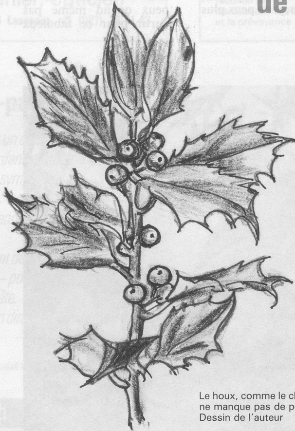
Le houx, comme le champagne, ne manque pas de piquant. Dessin de l'auteur

Encore que la glu, selon un guérisseur du Moyen Age, ait des vertus médicinales: «La glu de houx, écrit-il, amollit, résout et conduit à suppuration les tumeurs endurcies. Pour cet effet, on fait un cata-