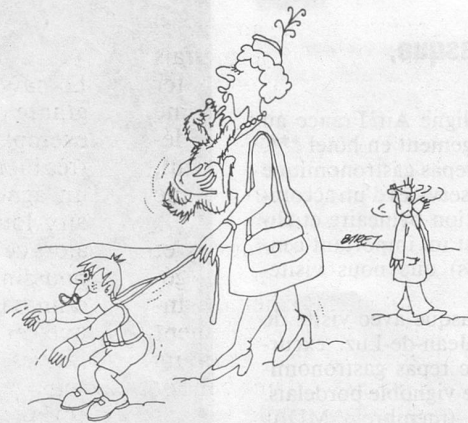
Sans paroles. (Dessin de Biret, Cosmopress, Genève)