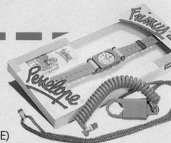
FRIMUS (BLEU) POUR GARÇONS