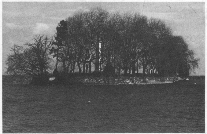
L'île et le monument Laharpe dans le port de Rolle.