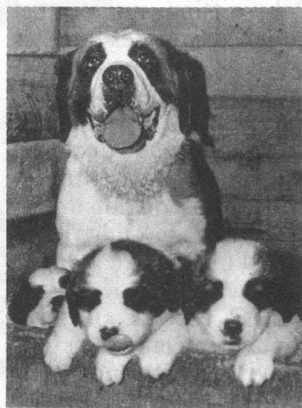
Deux extrêmes : lequel est le plus doux ?