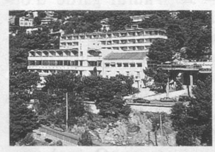
La vue de l'hôtel Altaea.

nos voyageurs se verront offrir une semaine de vacances supplémentaires. Un beau cadeau! Les hôteliers d'Amélie font bien les choses! Rappelons que la station thermale d'Amélie-les-Bains est située au pied des Pyrénées, à 30 km de la Méditerranée et de Perpignan. Une animation quotidienne agrémentera le séjour, ainsi que des excursions en France et en Espagne toute proche (tout est compris dans le prix). 15 jours au Gd Hôtel Palmarium**, en ch. 2 lits tout confort: Fr. 1388.- par personne (en chambre 1 lit: Fr. 1645.-). 15 jours à l'Hôtel Palm'Tech*, en ch. 2 lits