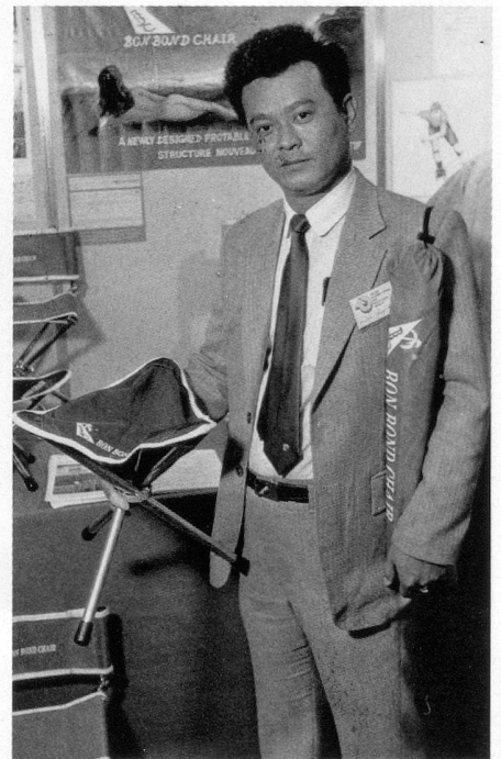
Ça se porte à l'épaule. Un parapluie? Mieux que ça: un siège pour longues randonnées.

pos en transformant une sorte de canne en une mignonne petite chaise-pliant. Le tout portable à l'épaule. Et comme j'aime les animaux, j'ai craqué, ému, devant une veste-aquarium en plastique transparent permettant de promener ses poissons rouges tout en ne passant pas inaperçu.