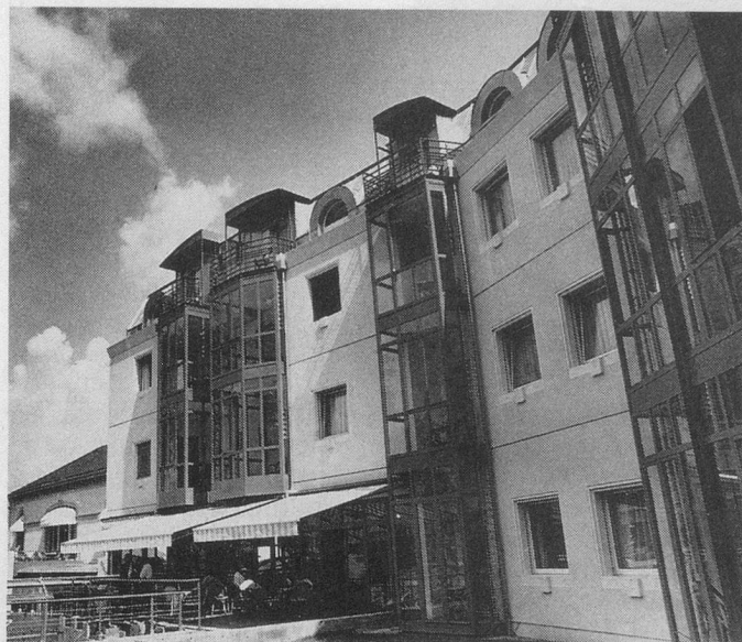
La nouvelle aile de l'Hôtel des Bains.