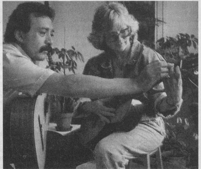
Le Troc-Temps, c'est l'offre et la demande des compétences de chacun.