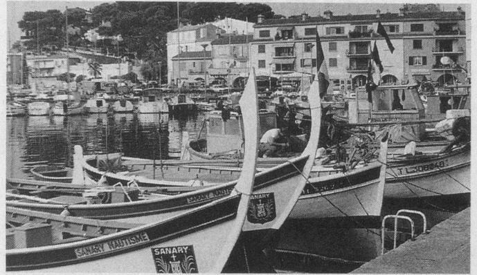
Le port de Sanary

«Aïnés» et Wagons-Lits Tourisme vous proposent ce magnifique voyage-croisière pour le prix de Fr. 1995.- par personne, vols, croisière, pension complète et visites. Billets CFF 1 re classe gratuits du domicile à Zurich et retour. Voyage accompagné, guides pour les visites. Le nombre de places étant limité, il est conseillé de réserver dès que possible. Un inoubliable circuit; un merveilleux cadeau de Noël offert à un prix sans concurrence vu la qualité des prestations.