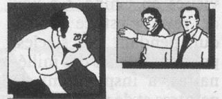
Arthrose, arthrite, rhumatisme, douleurs dans les épaules et la nuque, douleurs musculaires.

prolongé, il représente la possibilité de diminuer l'emploi et la quantité de médicaments qui, dans certains cas, deviennent difficiles à supporter.