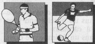
Tendo-vaginite des joueurs de tennis, blessures du sport, massages.

L'Onguent Melbrosin-Propolis est une préparation principalement à base de propolis, un mastic résineux que les abeilles produisent pour protéger leurs provisions des bactéries et des virus, mais qui, dans cette préparation, peut être aussi très utile aux hommes. Tandis qu'elle exerce une action analgésique par les substances aromatiques et les esters qu'elle contient, les baumes et les composants phénoliques luttent contre l'inflammation. Ainsi le Dr W. Salomon rapporte des cas d'arthrose de l'articulation du genou, de tendo-vaginites des joueurs de tennis, de tendinites, etc, dans lesquels le traitement avec l'Onguent Melbrosin-Propolis s'est avéré excellent.