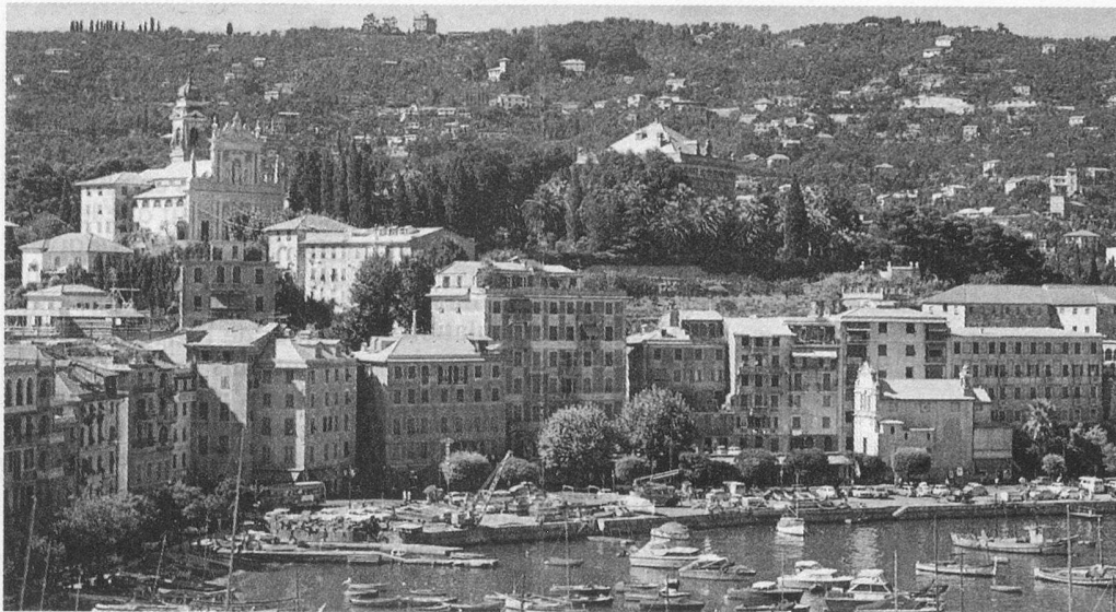
Santa Margherita, Costa del Liguria.