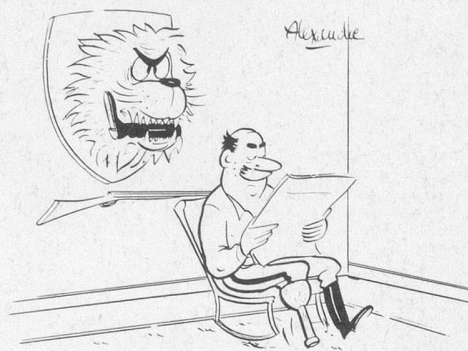
Sans paroles. Dessin d'Alexandre, Cosmopress Genève.

Ne pas utiliser ce coupon pour le renouvellement de l'abonnement svp.