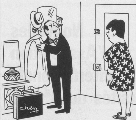
- Ça me suffit d'entendre râler mon patron; lui, il me paye pour ça! Dessin de Chen, Cosmopress Genève.

Ne pas utiliser ce coupon pour le renouvellement de l'abonnement svp.