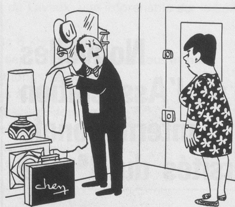
- Ça me suffit d'entendre râler mon patron; lui, il me paye pour ça! Dessin de Chen, Cosmopress Genève.

Ne pas utiliser ce coupon pour le renouvellement de l'abonnement svp.