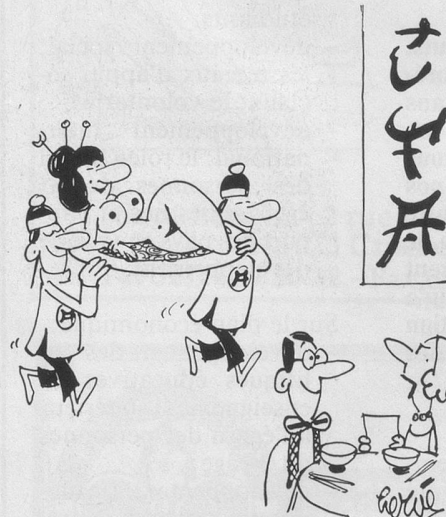
- Quelle est la spécialité chinoise que tu as commandée? Dessin de Hervé, Cosmopress Genève.