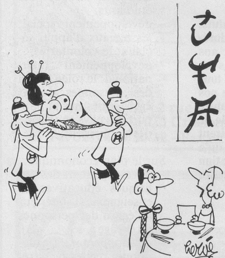
- Quelle est la spécialité chinoise que tu as commandée? Dessin de Hervé, Cosmopress Genève.