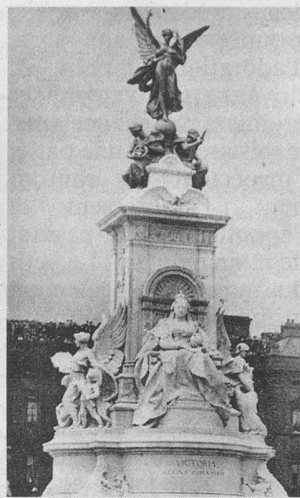
Inauguration du Mémorial de la reine Victoria à Londres.