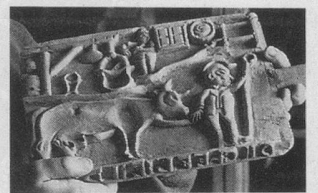
Moule du XIX e siècle.