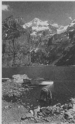
L'Oeschinensee, près de Kandersteg.

tiative, due à un habitant de la ville passionné d'informatique pendant ses loisirs, a déjà permis de sauver plusieurs personnes, dont une qui était tombée dans le coma à la suite d'une crise de diabète.