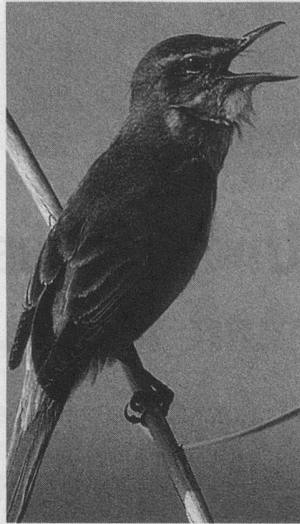
La rousserolle turdoïde chante dans l'épaisse roselière pour y attirer une femelle et pour en éloigner ses rivaux.

Le rossignol, le coucou, les hirondelles et les martinets en dernier. Après avoir passé l'hiver en Afrique loin du froid, ils reviennent se reproduire chez nous. Depuis les premiers jours de février déjà, le chant des étourneaux nous égaie. Les merles, les alouettes et les pinsons ont commencé à chanter dès les premiers signes du printemps en mars. Le concert des oiseaux est-il à nouveau aussi beau et aussi riche que l'an passé?