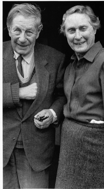
... et récemment à Commugny.

George de Mestral s'en est allé consulter le Bureau des inventions à Berne, afin de vérifier si rien n'avait encore été fait dans ce domaine. Les petites boules de bardane allaient lui permettre de réaliser une invention de taille: le Velcro! Entre la bardane et le Velcro, il s'est écoulé six ans, six années de recherches intenses, au cours desquelles il a eu des encouragements, mais aussi de l'indifférence. Cet ingénieur formé au Polytechnicum de Lausanne n'a pas toujours été bien accueilli outre-Sarène, où se trouvaient les industriels susceptibles de commercialiser son invention, et il ne se gêne pas de le souligner encore aujourd'hui.