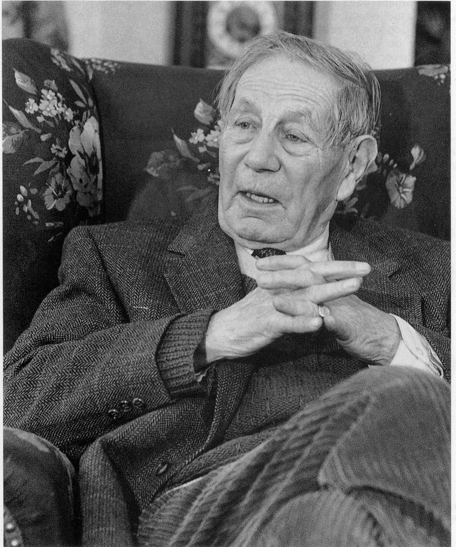
George de Mestral nous parle de ses lectures préférées: les revues scientifiques.