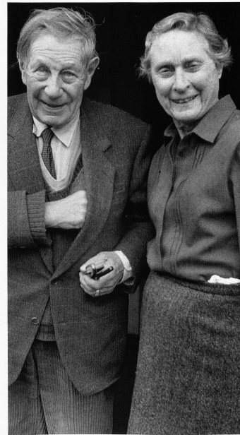
... et récemment à Commugny.

George de Mestral s'en est allé consulter le Bureau des inventions à Berne, afin de vérifier si rien n'avait encore été fait dans ce domaine. Les petites boules de bardane allaient lui permettre de réaliser une invention de taille: le Velcro! Entre la bardane et le Velcro, il s'est écoulé six ans, six années de recherches intenses, au cours desquelles il a eu des encouragements, mais aussi de l'indifférence. Cet ingénieur formé au Polytechnicum de Lausanne n'a pas toujours été bien accueilli outre-Sarène, où se trouvaient les industriels susceptibles de commercialiser son invention, et il ne se gêne pas de le souligner encore aujourd'hui.