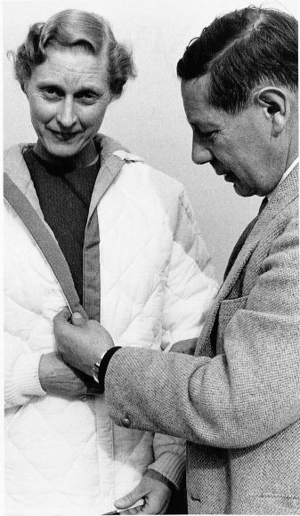
George de Mestral et son épouse, à l'époque de la découverte du Velcro...