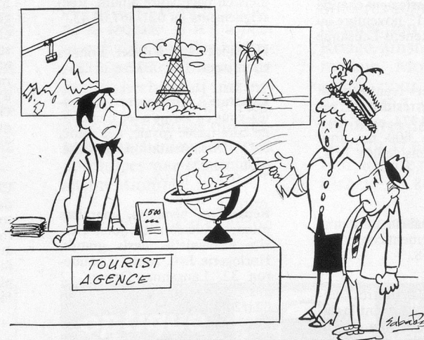
— On a déjà tout vu. Vous n'auriez pas un autre globe à visiter? Dessin de Sabatès.