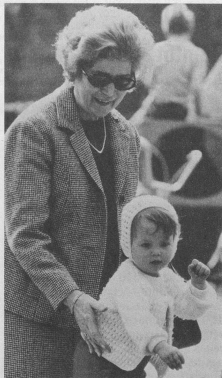
Il sorriso di una nonna ringiovanita nel contatto con bambini.

Le telefonate delle candidate nonne all'Ufficio Stampa di Pro Senectute Ticino (Lugano tel. 091/23 19 46) hanno rivelato molta solitudine, molta disponibilità a dare aiuto e conforto agli altri, una comprensione per le difficoltà delle giovani famiglie nata