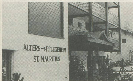
Home et foyer de jour Saint-Maurice à Zermatt.