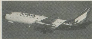
Le Boeing 737 de Malev au décollage.

Une semaine passionnante placée sous le signe de l'amitié. Le point culminant de ce voyage sera la rencontre dans la banlieue