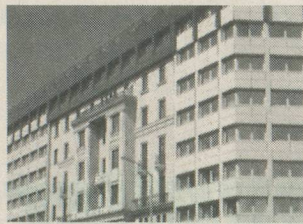
Votre hôtel Ungaria à Budapest.