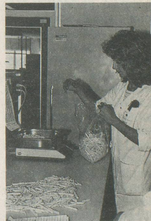
Le contrôle de qualité des frites en laboratoire est une opération délicate et indispensable.