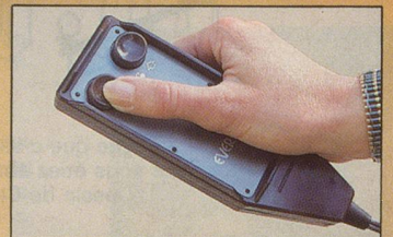
Commande électrique en option.