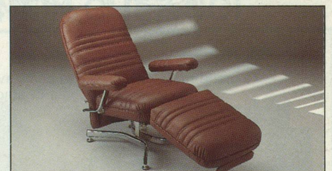
Everstyl «Trocadéro» ligne mode contemporaine