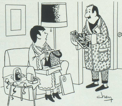
– Tu n'as rien mis dans le sac pour l'étréner!... Dessin de Chen, Cosmopress, Genève