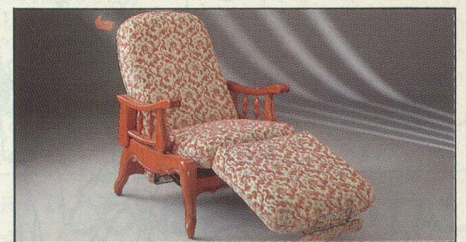
Everstyl «Elysée» fauteuil rustique

Notre catalogue gratuit vous présente un grand choix de modèles (rustique, contemporain, style) et de revêtements : velours, très beau cuir et cuir de synthèse. Finition « décoration », robustesse à toute épreuve : Everstyl est bâti pour défier le temps... Profitez de son prix « vente directe usine », dans toute l'Europe, sans intermédiaire.