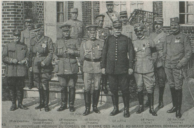
Les Alliés, fin 1916. Entourant Joffre, les représentants des armées française, anglaise, belge, russe, italienne et serbe.

Troisième année de guerre; une guerre qui innove et qu'on ne peut comparer à aucune autre. Elle embrase un continent et sillonne les mers où la bataille fait rage. Sur terre, elle se tapit au fond des tranchées. Les gaz toxiques ont fait leur apparition. Les populations civiles n'échappent pas aux massacres. Qui gagne la veille perd le lendemain. Difficile dans de telles conditions d'annoncer la couleur de la victoire finale. Des hommes, par millions, souffrent, connaissent un enfer que ceux de l'arrière n'imaginent même pas.