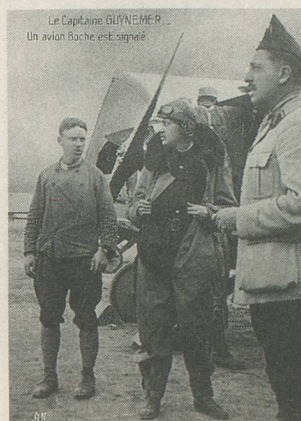
Le capitaine Guynemer a signé 53 victoires.

De grandes voix se sont tues, de superbes talents se sont éteints, des héros sont entrés dans la légende. Guynemer, par exemple, mort le 11 septembre au combat. Engagé dans l'aviation à 20 ans, en 1914, ses 53 victoires lui