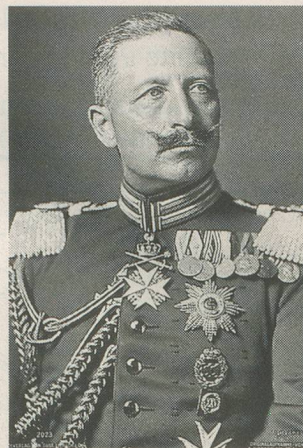
Le Kaiser Guillaume II s'ennuyait à la cour...

janvier déjà, le président Wilson a présenté au Congrès son fameux plan de paix en 14 points. La Russie est devenue la République socialiste fédérative soviétique. Le 17 juillet le Tsar et sa famille sont massacrés à Iékatérinenbourg. Un nouveau monde naît à l'Est. L'armée allemande se démène: son aviation bombarde Paris et Londres, et la Grosse Bertha entre en transes. Le traité de paix de Brest-Litovsk signé par l'Union soviétique et les puissances centrales fera long feu. Après plusieurs secousses dans les Flandres et sur la Marne, les revers allemands s'accroissent et entraînent la démission de Ludendorff, commandant suprême avec Hindenburg. En Lorraine, les Américains joignent leurs forces à celles des Français. Tout se précipite. Le 3 octobre, le chancelier Max de Bade envoie une note de paix à Wilson. De son côté, l'état-major autrichien exige la conclusion d'un armistice immédiat et, le 26 octobre, le gouverne-