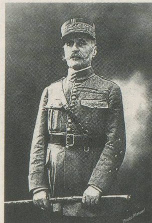
Foch, maréchal de France, commandant des forces alliées.

En France et chez les Alliés on exulte: le cauchemar a pris fin. Le 11 novembre, l'armistice est signé à Rethondes. Paris ac-