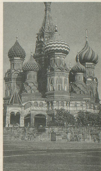
La cathédrale Saint-Basile, à Moscou.

Voyage sous réserve de l'évolution des événements en URSS