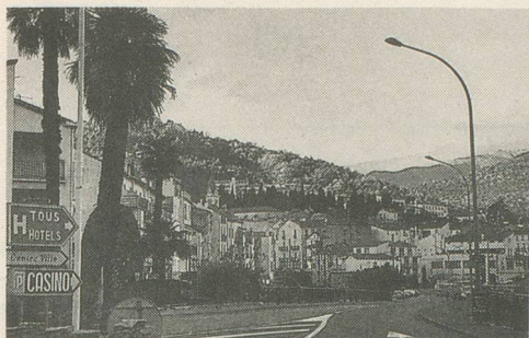
Les palmiers poussent au pied des Pyrénées à Amélie.

Quatorze années de succès! Nos lecteurs connaissent bien Amélie qui laisse de merveilleux souvenirs à la foule de ceux ayant déjà eu le bonheur d'y séjourner. Au cœur du Roussillon, à 30 km de la Méditerranée et de Perpignan, cette ville connue par ses eaux et la grande beauté de sa région est idéale pour un séjour de repos et de cure d'air.