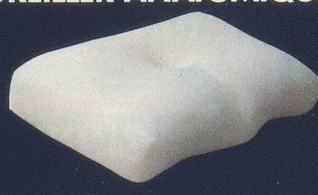
Enveloppe ouatinée dimensions : 54 x 34 cm.