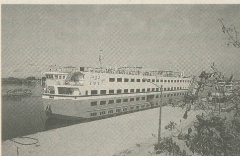
Le bateau-hôtel Sheraton

ordre. Visites de la Citadelle, du Bazar Khan El Khalili. Le lendemain, Musée national d'antiquités avec le trésor de Toutankhamon, pyramides de Guizeh, Memphis et Sakhara.