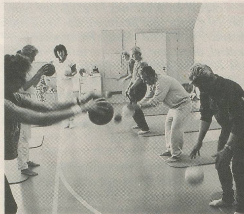
Les cours de l'Ecole du dos de la Ligue suisse contre le rhumatisme se déroulent en petits groupes sous la direction d'un physiothérapeute. Les participants y apprennent à adopter des postures correctes pour tous les gestes de la vie quotidienne.

Les connaissances bio-mécaniques et physio-pathologiques actuelles permettent d'incriminer dans une bonne partie des cas un vice postural, dynamique ou statique, provoquant ou entretenant cette douleur, expliquant ainsi les alternances de récurrence et d'amélioration chez un patient donné. Souvent, ce problème se double d'une pathologie psychiatrique, celle-ci n'entrant de toute évidence pas dans le cadre thérapeutique de l'Ecole du dos. Il faudra distinguer l'épisode aigu, s'accompagnant ou non d'une complication neurologique et qui justifiera un traitement médical ou chirurgical, du