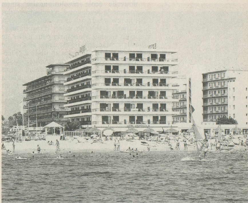
Hôtel Monte-Carlo, Rosas

Et, bien sûr, nous retournons à Rosas (Espagne), un de nos grands succès!